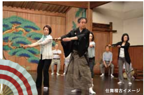
仕舞稽古イメージ