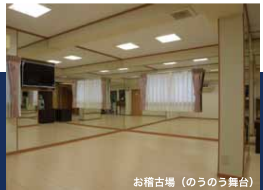
お稽古場 (のうのう舞台)

観世流シテ方。1970年生まれ。観世喜之の長男。東京・神楽坂の矢来能楽堂を本拠地として、全国各地のさまざまな会場で、演能・プロデュースをこなす。また、能楽以外の芸能とも積極的に交流をはかりながら国内外を問わず多数の公演に参加。教育現場での能の普及活動や講演も多く、NHKの能楽指導・監修、ドラマや企画番組にも出演している。著書「演目別に見る能装束1・2」。重要無形文化財総合指定保持者。法政大学大学院、皇學館大学非常勤講師、(公社)能楽協会理事、(公社)観世九草会理事。