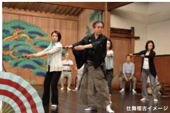
仕舞稽古イメージ