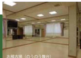
お稽古場 (のうのう舞台)

観世流シテ方。1970年生まれ。観世喜之の長男。東京・神楽坂の矢来能楽堂を本拠地として、全国各地のさまざまな会場で、演能・プロデュースをこなす。また、能楽以外の芸能とも積極的に交流をはかりながら国内外を問わず多数の公演に参加。教育現場での能の普及活動や講演も多く、NHKの能楽指導・監修、ドラマや企画番組にも出演している。著書「演目別に見る能装束1・2」。重要無形文化財総合指定保持者。法政大学大学院、皇學館大学非常勤講師、(公社)能楽協会理事、(公社)観世九阜会理事。