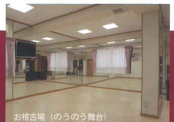
お稽古場 (のうのう舞台)