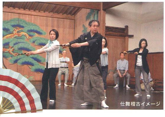
仕舞稽古イメージ