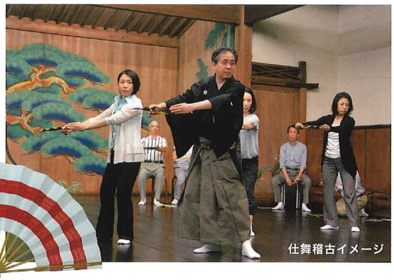
仕舞稽古イメージ