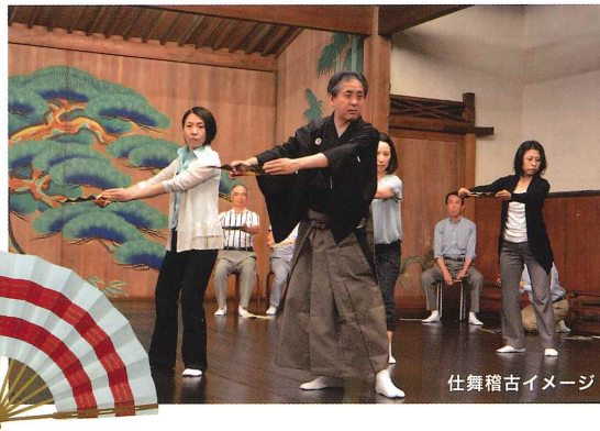
仕舞稽古イメージ