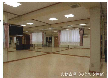
お稽古場 (のうのう舞台)